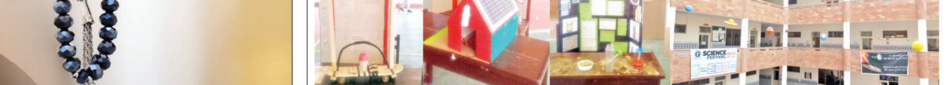
گزشتہ دنوں اٹلیکٹ اسکول میں سائنسی نمائش کا انعقاد ہوا، اس موقع کے چند مناظر

ہفتا کی ویڈیو چینل پر بیت السلام کی خدمات کا ذکر ویب سائٹ پر مضمون افزہ (مائیک ڈیسک) بیت السلام شامی مسلمان بھائیوں کے لیے جو امداد ترک رفاهی اداروں کے تعاون سے فراہم کر رہا باقی صفحہ نمبر 3، 05