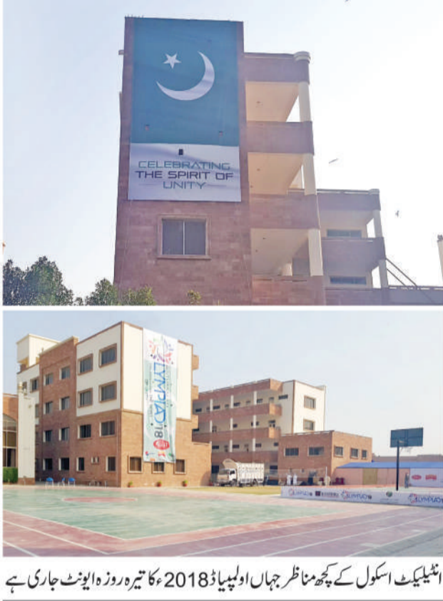
اٹلیکٹ اسکول کے کچھ مناظر جہاں اولمپیاڈ 2018ء کا تیرہ روزہ ایونٹ جاری ہے