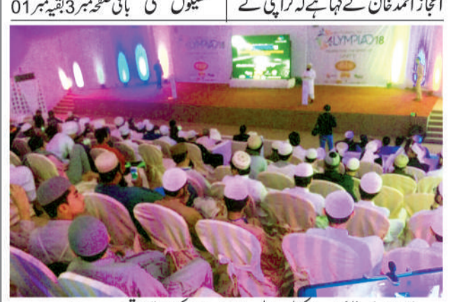
آڈیو ریگ اٹلیکٹ اسکول، اولمپیاڈ 2018ء کی افتتاحی تقریب جاری ہے

تعاون کے ذریعے اداروں اور تنظیموں کی حوصلہ افزائی کی جائے گی۔ اس ایونٹ کے مقصد سے اساتذہ کے ہمراہ شرکت کریں گے اور ان کے ساتھ ساتھ دیگر سماجی شخصیات نے بھی شرکت کی ہے۔